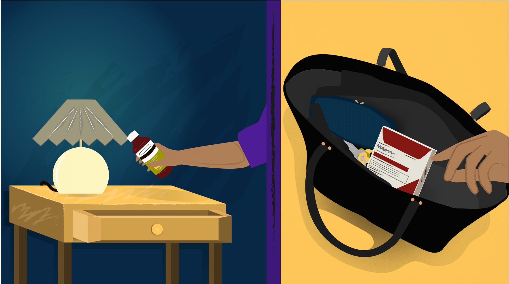
NARRADOR: las habitaciones, las carteras o en cualquier lugar donde guarda medicamentos.