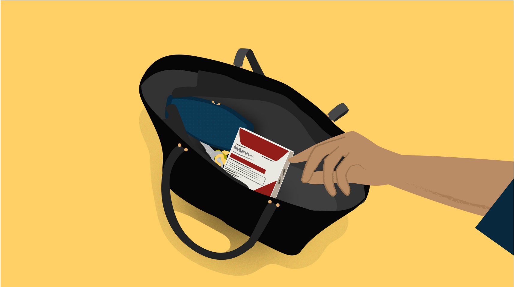
NARRADOR: o en cualquier parte.