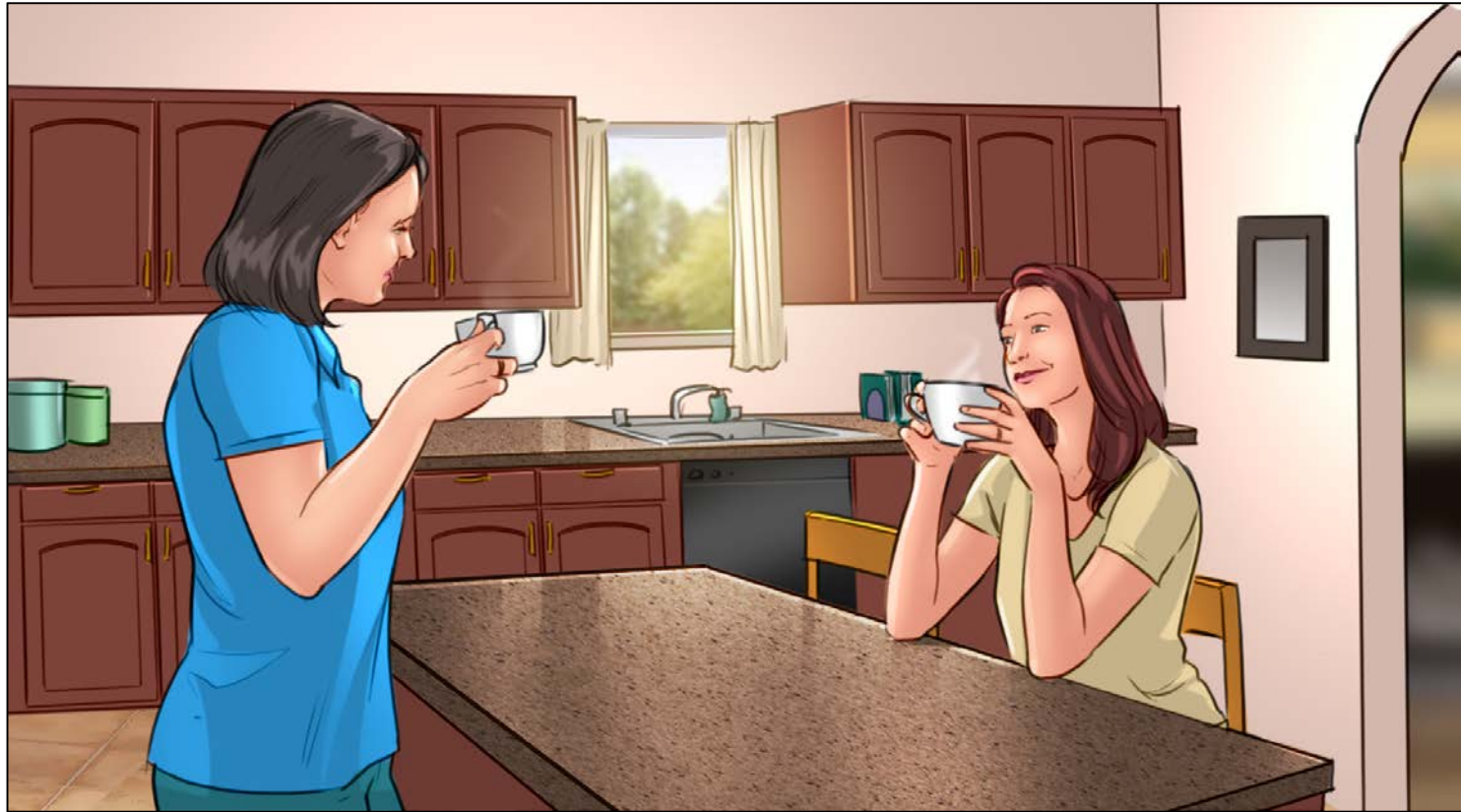
Mujer 2 y mujer 3 están tomando café y hablando en la cocina.